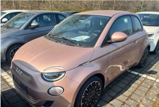
Autozentrum STEINER Netphen www.autozentrum-steiner.de